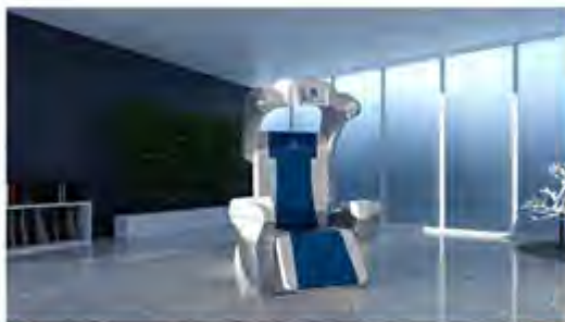
Abb. 1 ◀ Pelvic Center